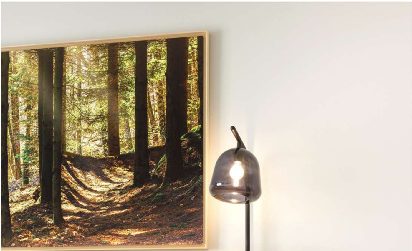
Studio & appartement